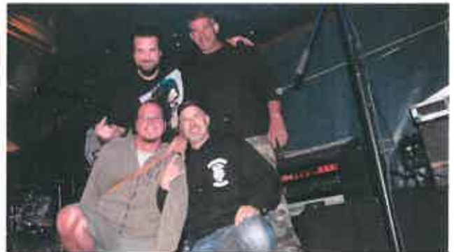
Les Sal'Goss à la fête de la musique le 14 juin 2014.

Rien ne restant à l'ordre du jour, la séance est levée à 22h55 mn.