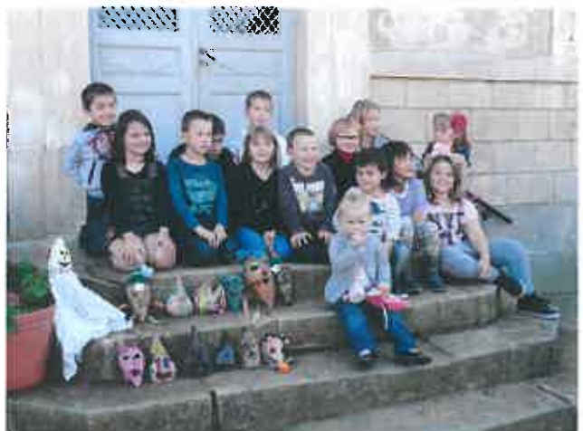
Fête de la betterave le 18 Octobre 2014.